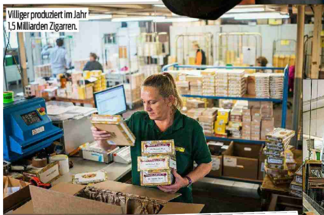
Villiger produziert im Jahr 1,5 Milliarden Zigarren.