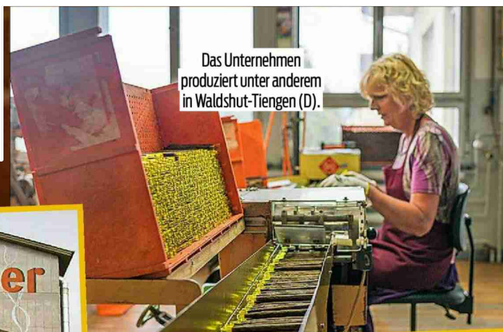
Das Unternehmen produziert unter anderem in Waldshut-Tiengen (D).